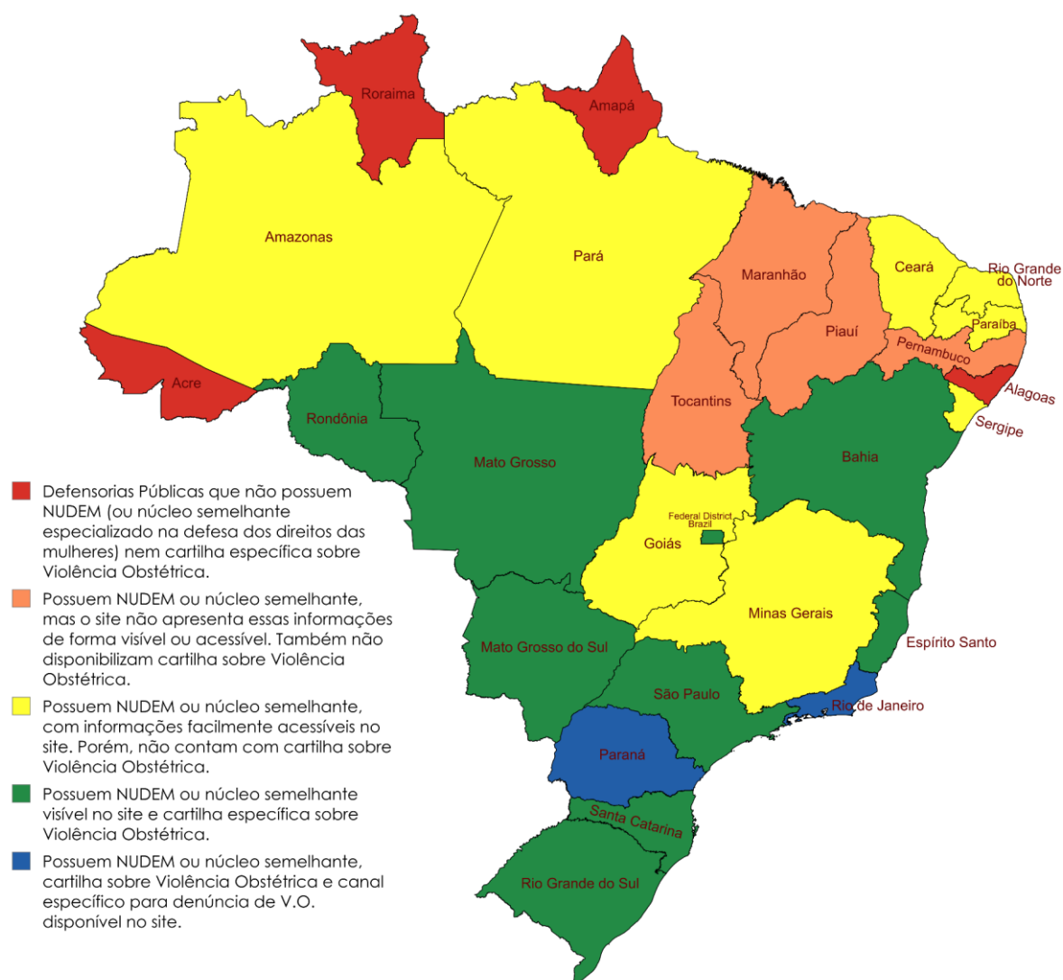
Figura 2. Presença de Núcleos Especializados em direitos das mulheres nas Defensorias Públicas e cartilhas sobre violência obstétrica nas unidades da federação